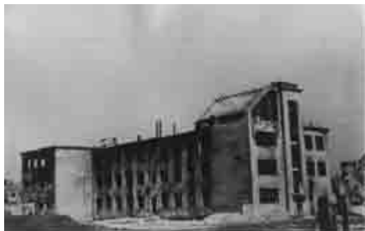
Здание музея после войны

освобождения Беларуси. Здание, в котором до войны располагался музей, было занято немцами под военный госпиталь, а после их отступления частично разрушено. Фашисты вывезли богатейшую коллекцию охотничьих трофеев копытных животных, тропических насекомых и другие ценные экспонаты.