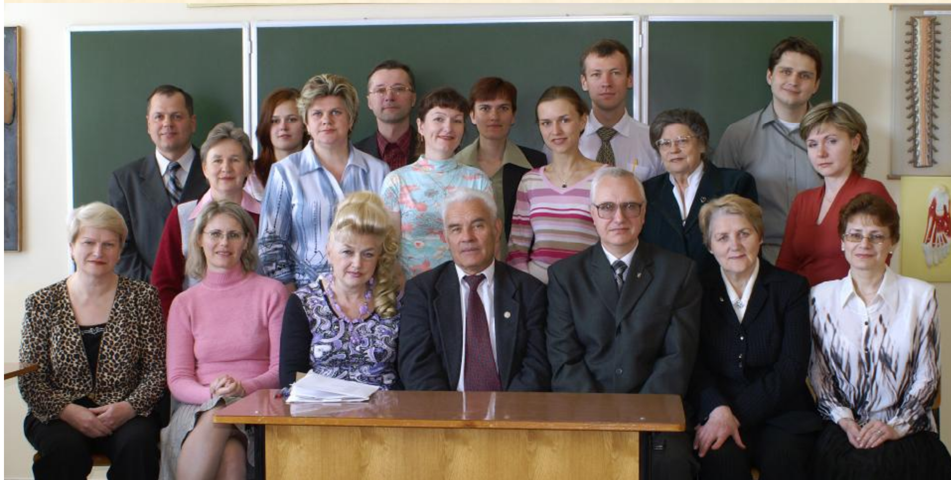
Коллектив кафедры физиологии человека и животных 2007