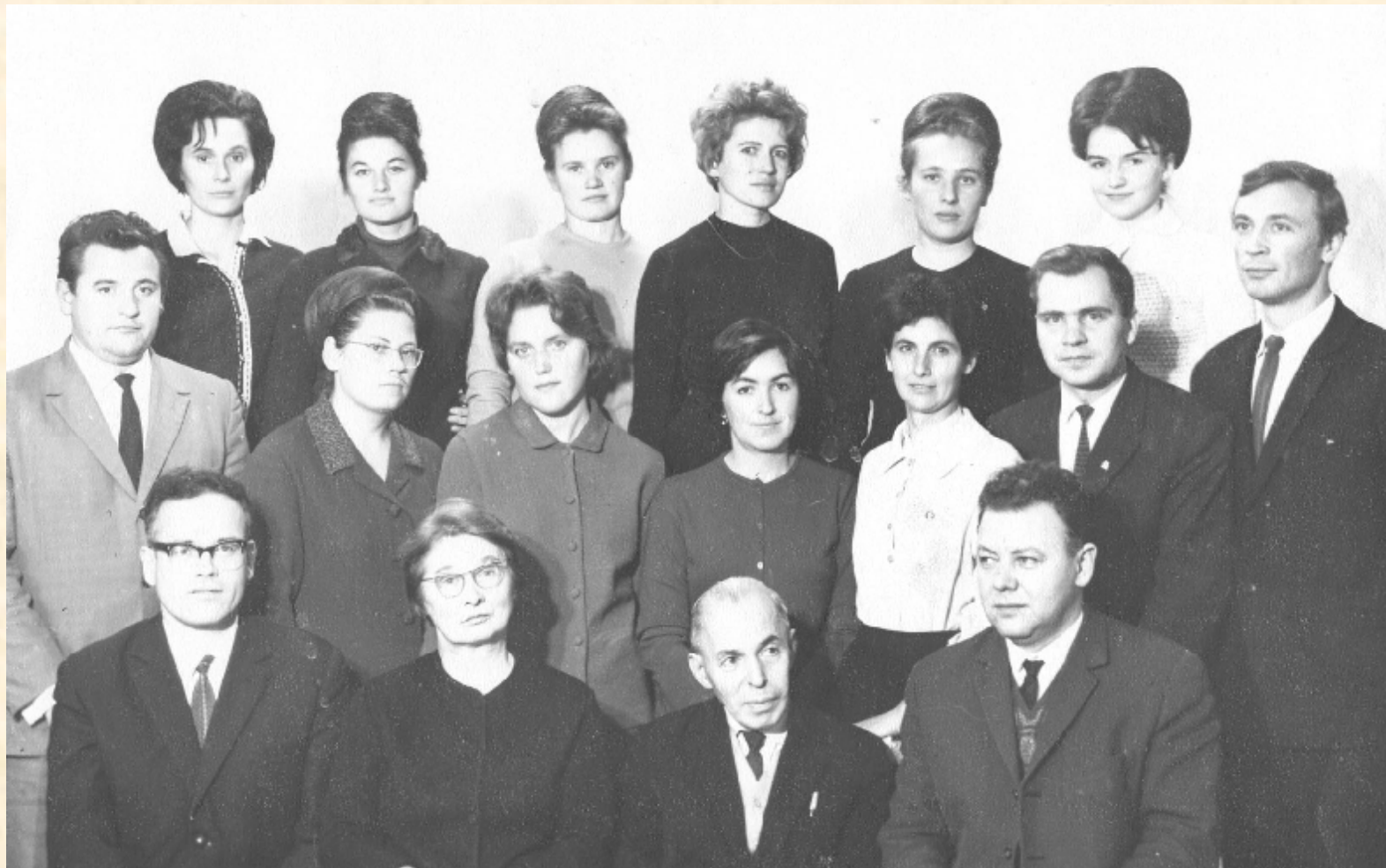
Кафедра физиологии, 1961 г.